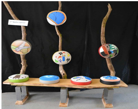
Banc surréaliste –Exposition au CNAM –PARIS Réalisation des élèves du Lycée Victor Lépine

le métier de tapissier-tapissière offre des débouchés variés sur le territoire normand.