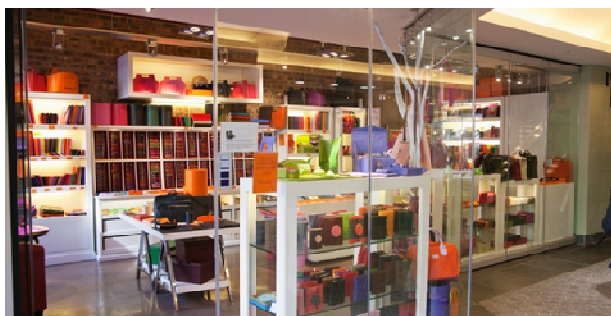
Mise en scène de produits

Séduire les passants, leur donner envie d'entrer, peut-être d'acheter. C'est l'idée essentielle du marchandiseur qui met en scène les produits dans les vitrines des magasins, sur les stands des foires et des expositions.