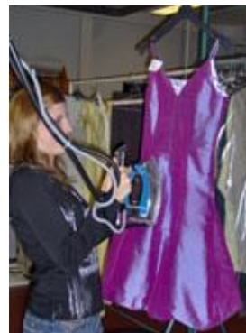
Table à repasser et fer traditionnel ,mannequin chauffant/soufflant

Différents matériels peuvent être utilisés :